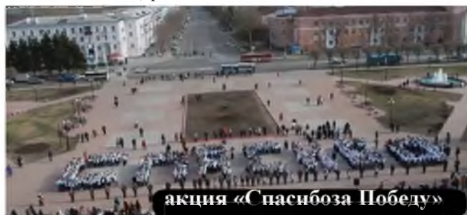
акция «Спасибоза Победу»

Под таким названием прошла акция 7 мая на площади ДК ЗЛК. Учащиеся школ города выстроились в живое слово СПАСИБО и исполнили знаменитую песню «День победы». Вторую букву «С» составляли учащиеся и нашей школы, ребята 5А и 8А классов.